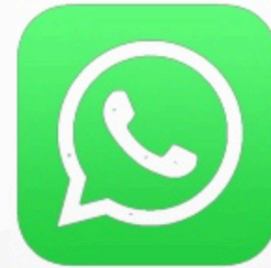
Somepalvelujen käyttö Suomessa 04/2019